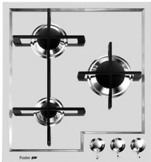
Table de cuisson Veronika